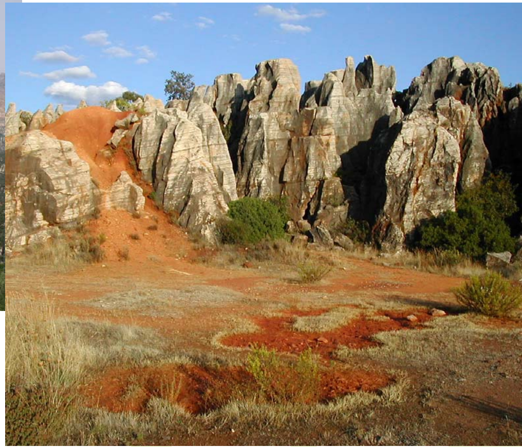
PN Sierra Norte de Sevilla (Sevilla)