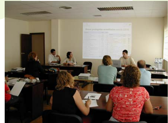
Reuniones de los grupos de trabajo y jornadas con el sector turístico