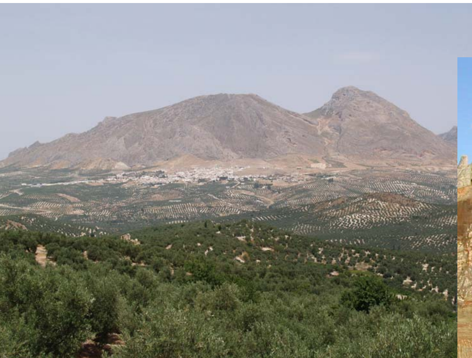
PN Sierra Mágina (Jaén)