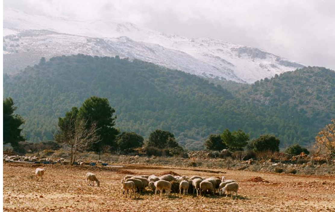
PN Sierra María-Los Vélez (Almería)