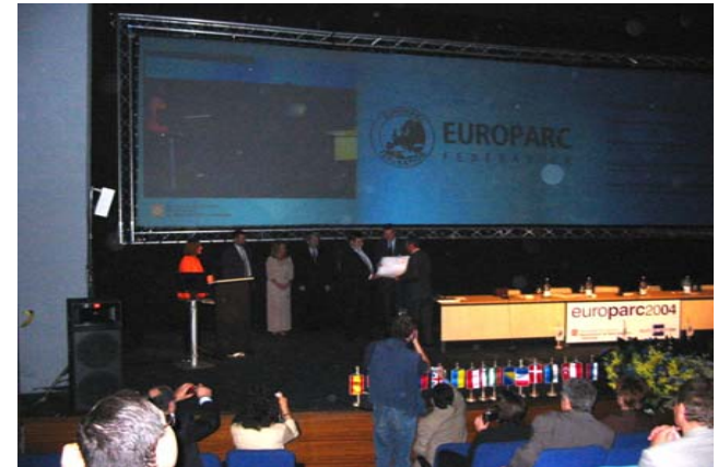
EUROPARC certifica la CETS