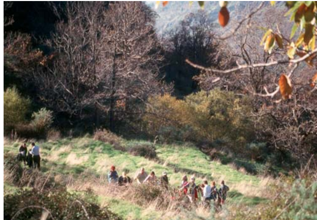
Estrategia y Plan de Acción