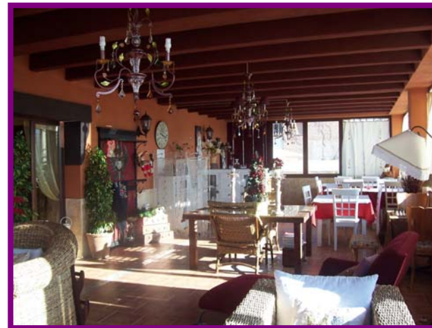
EL LAUREL DE LA REINA