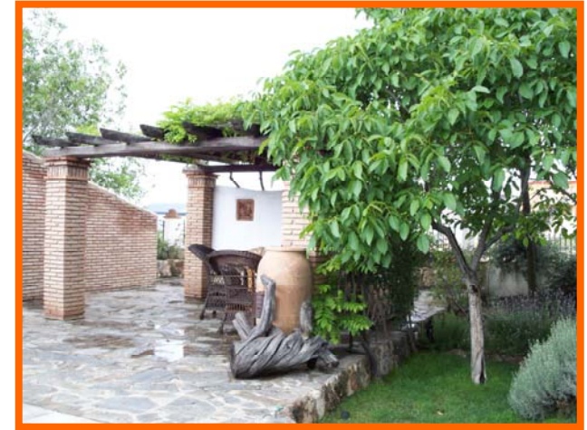
EL RINCÓN DE PEPA