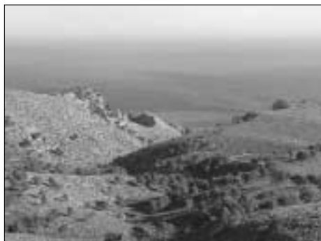
Aubarca- Es Verger, en el Parque Natural de la Península de Llevant

El pasado 27 de febrero se inauguró la oficina y centro de información del Parque Natural de la Península de Llevant i reserves naturals de cap de Farrutx y cap des Freu (Mallorca). La oficina está ubicada en el núcleo urbano de Artà, fuera de los límites del Parque, en el municipio que mayor superficie de territorio aporta al espacio protegido. Al acto de inauguración asistieron la Consejera de Me-