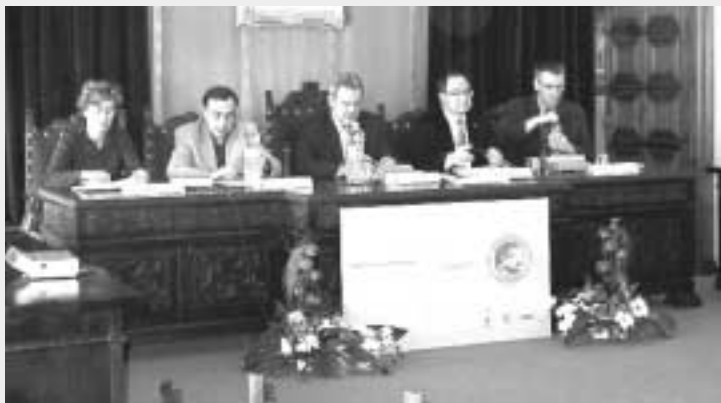
Acto de clausura del ESPARC 2003 presidido por el Consejero de Medio Ambiente del Gobierno de Aragón

Para más información: oficina@europarc-es.org