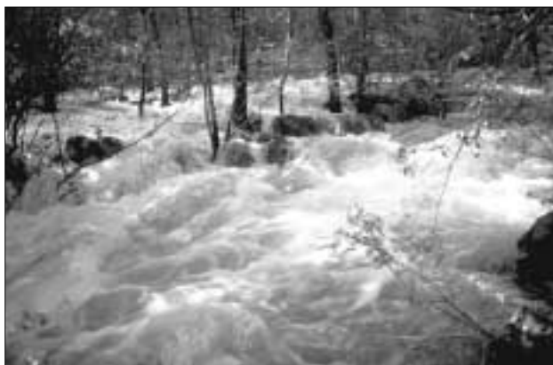
Monumento Natural Ses Font Ufanes.

Para ello se ha estandarizado en los Planes de Ordenación de los Recursos Naturales (PORN) el diseño zonal sobre la base de una matriz normalizada con la finalidad de establecer las compatibilidades e incompatibilidades de usos, actividades y aprovechamientos, y establecer luego las correlaciones correspondientes en los diferentes grados de ordenación en cascada: los Planes Rectores de Uso y Gestión (PRUG), los planes