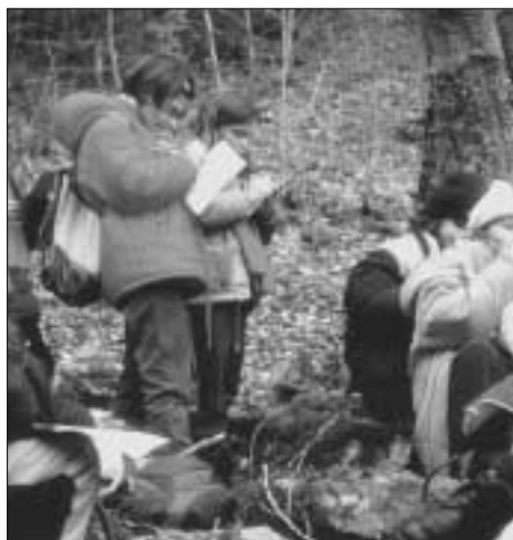
Autor: María García de Vinuesa.

La jornada de campo comienza con una visita al Centro de Interpretación del Parque Natural. Los muchachos, guiados por un monitor, recorren la exposición Paisajes de una historia y ven el audiovisual del mismo título, centrado en la influencia de la actividad humana en el entorno. Después van en autobús a la Ermita de Lomos de Orios, donde almuerzan. Aquí co-