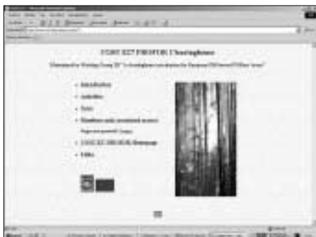
Sitio web del Grupo 3 mecanismo de compensación de la Acción COST-E27.

La Acción comunitaria COST E-27 Áreas forestales protegidas en Europa: análisis y armonización, que celebró su reunión inaugural en Bruselas el pasado 1 de marzo de 2002, ha celebrado ese año dos reuniones de sus grupos de trabajo, en Joensuu (Finlandia) y Bruselas (Bélgica).