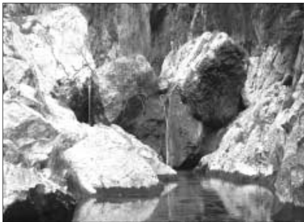
Enclave natural en Sa Fosca.

Uno de los elementos que contribuyen a la cohesión de la organización administrativa de la gestión de la Red es el de la imagen corporativa que adopta, imagen que se proyecta sobre todo un conjunto de manifestaciones de la gestión, como por ejemplo la divulgación y educación, la señalización del espacio, la identificación de marcas de calidad, las publicaciones periódicas, entre otras. Para ello se ha renovado por completo la identidad gráfica de los parques, con nuevos logotipos actualizados y un elemento común el logotipo de la Red, como un objeto de cohesión con miras al futuro.