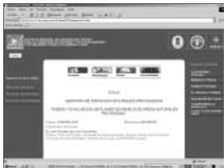
Página web del curso FODEPAL de áreas protegidas.

El pasado 15 de marzo de 2003 dió comienzo el curso de formación en campus vir-