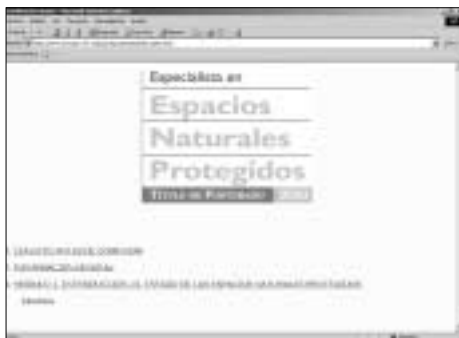
Página web de la edición 2003 del curso de postgrado de especialista en espacios protegidos.

En esta tercera edición del curso que convocan las Universidades Autónoma de Madrid, Complutense y de Alcalá, junto con la Fundación Fernando González Bernáldez y EUROPARC-España, se ha registrado nuevamente un elevado interés, de modo que las solicitudes de inscripción han superado con mucho las 40 plazas disponibles. Entre los alumnos finalmente matriculados ha aumentado la proporción de técnicos pertenecientes a distintas administraciones con competencia en espacios protegidos, así como otros profesionales activos en el sector ambiental. El alumnado se completa con jóvenes titulados en biología, ciencias ambientales, ingeniería de montes, geografía, etcétera, interesados en orientarse profesionalmente hacia este campo. Como en años anteriores, algunos de los alumnos han contado con becas y ayudas financiadas por FUNCAS. Además, en esta ocasión se ha dispuesto de 10 becas de la Fundación Carolina, financiadas por la Fundación BBVA, para alumnos latinoamericanos.