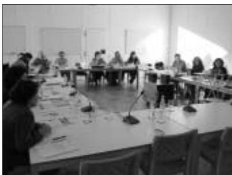
Desarrollo del seminario técnico de educación ambiental y red natura 2000.

tas y experiencias entre los planificadores y gestores de Natura 2000 y los técnicos responsables de educación ambiental en cada una de las Comunidades Autónomas, con el fin de aplicar los diferentes instrumentos de la educación ambiental en la puesta en marcha y desarrollo de la Red Natura 2000. Asistieron 21 técnicos de Educación Ambiental y Red Natura 2000 representando al Ministerio de Medio Ambiente, EUROPARC-España, seis Comunidades Autónomas (Andalucía, Aragón, Navarra, Valencia, Castilla y León y Murcia) y Ceuta.