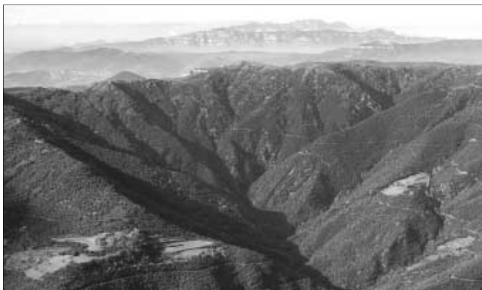
Panorámica de la Reserva de la Biosfera del Montseny.