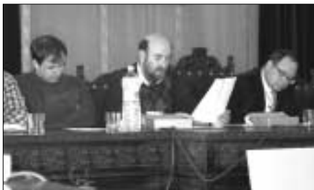
Lectura de las conclusiones consensuadas en los talleres del ESPARC 2003.

En el ESPARC 2003 se desarrollaron seis talleres de trabajo donde se abordaron los retos de integración que supondrá la puesta en marcha de la Red Natura 2000 desde distintas perspectivas (para más información sobre el ESPARC 2003 ver también Hoja Informativa 4 del Plan de Acción). Los talleres fueron: integración del ordenamiento jurídico comunitario a la normativa estatal y autonómica; integración de los mecanismos presupuestarios y extrapresupuestarios para la financiación de la Red Natura 2000; integración conceptual y territorial de las redes de conservación; integración de los instrumentos de planificación y gestión; integración de los procedimientos para la evaluación de planes y programas; nuevos horizontes de gestión.