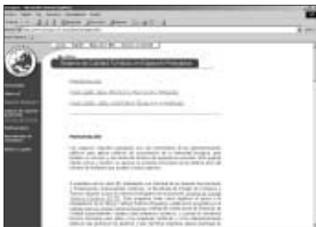
Sección del sitio web de EUROPARC-España dedicada al proyecto de sistema de calidad turística en espacios protegidos.

les (Sierra de Aracena, Sierra de Grazalema, Moncayo, Sierra de Guara, Somiedo, Hoces del Duratón, Lagunas de Ruidera, Sant Llorenç del Munt, L'Albufera, Monfragüe, Baixa Limia, Sierra Cebollera, y Cumbre, Circo y Lagunas de Peñalara), el Parque Rural de Teno y el Parque Regional de Sierra Espuña.