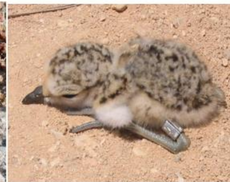
FIGURA 157. Pollo y huevo de charrán común (izquierda) y pollo de chorlítejo patinegro (derecha).