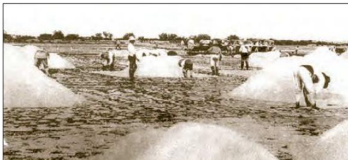
FIGURA 8 y 9. Molinos de viento y extracción de sal a principios del siglo XX.