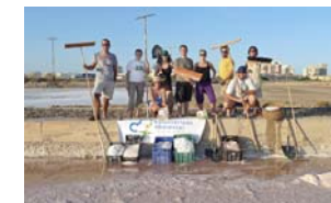
Foto 1. Cosecha de sal