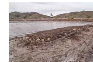
Foto 2. Postes para larolimícolas y motas-islas