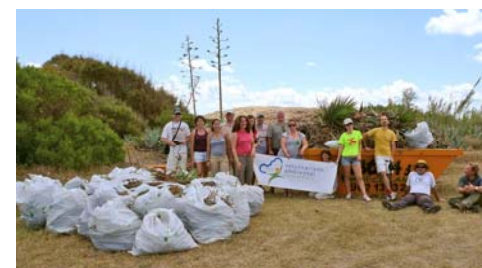
Foto 3. Eliminación de especies vegetales alóctonas