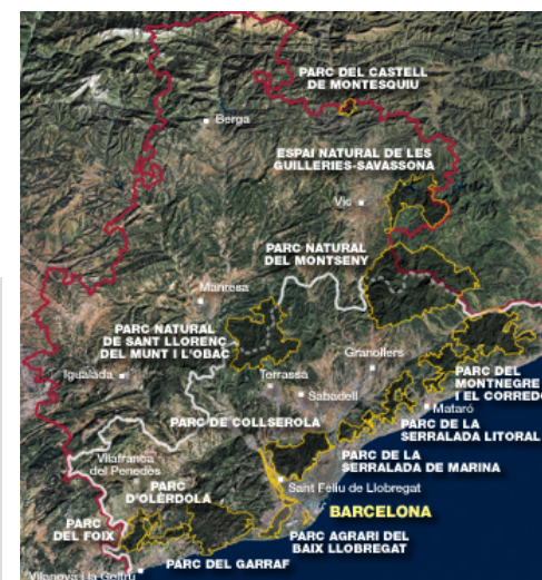
Red de parques Dip.Barcelona

Entidades implicadas: Diputación de Barcelona, Área de Territorio y Sostenibilidad