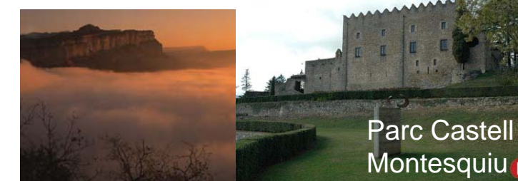
Parc Castell Montesquiú